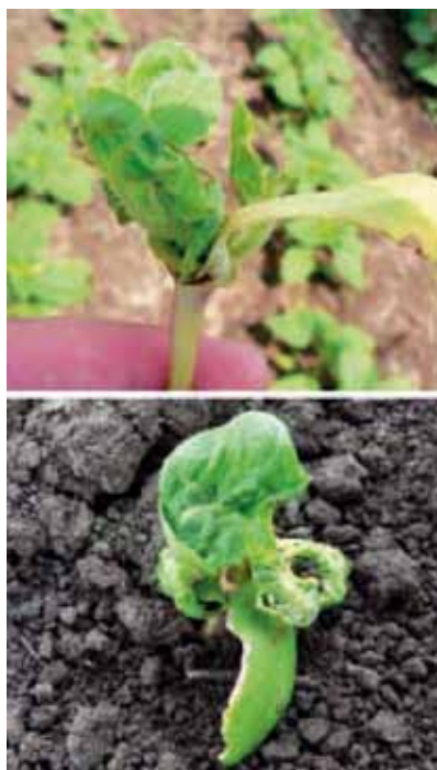
Рис. 1. Вплив фітотоксичності ацетохлору на рослини соняшнику

на наступних культурах в сівозміні (зернові чи кукурудза) з'являється падалиця соняшнику, що може бути стійкою до дії сульфонілсечовин, які зазвичай застосовуються на цих культурах. До того ж падалиця з'являється в такі фази розвитку зернових чи кукурудзи, коли вже не рекомендується використовувати гербіциди інших хімічних груп, наприклад, похідні синтетичних гормонів росту – дикамбу, 2,4-Д, які можуть її контролювати.