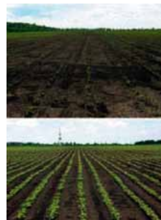
Рис. 2. Вплив фітотоксичності гербіцидів на посіви соняшнику

Пропоніт не потребує заробки в ґрунт в умовах достатнього зволоження, проте за відсутності опадів тривалий час до сівби культури заробка підвищує ефективність препарату. Неперевершена селективність Пропоніту дозволяє його використання без антидоту та виключає прояви фітотоксичності до культури навіть за умов випадання значних опадів і пониження температур. Має тривалу за-